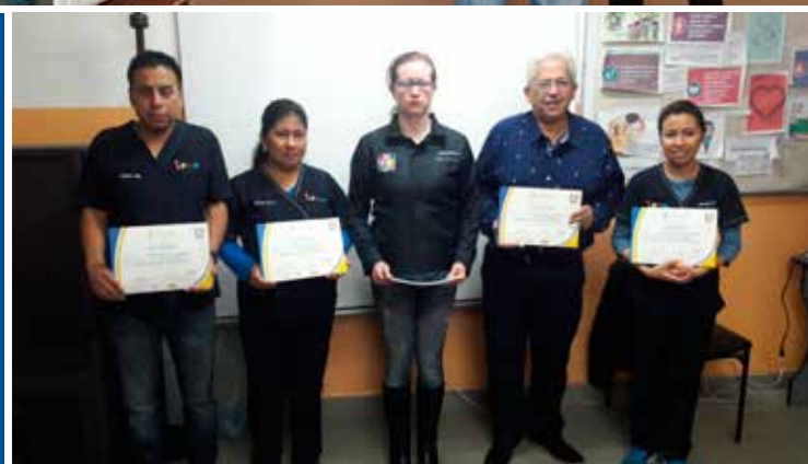
Azuay | Capacitación y formación en derechos y deberes a familias de personas con discapacidad.