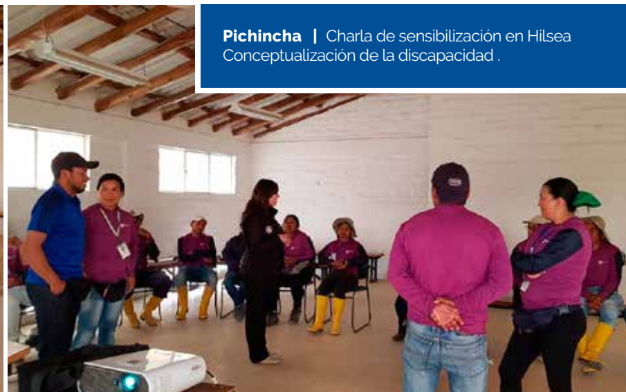
Pichincha | Charla de sensibilización en Hilsea Conceptualización de la discapacidad .