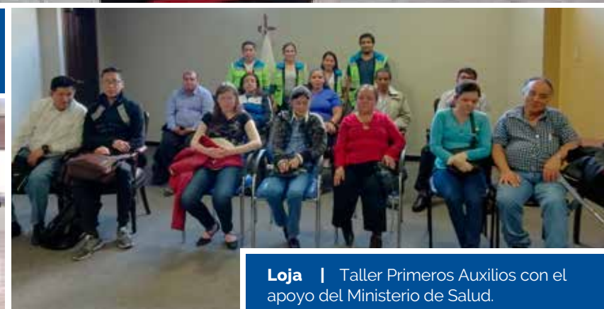
Loja | Taller Primeros Auxilios con el apoyo del Ministerio de Salud.