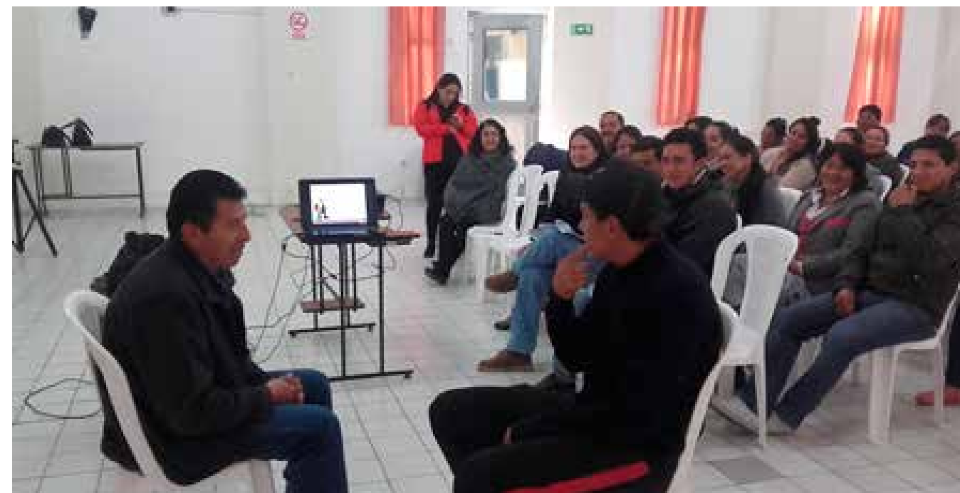
Chimborazo | Charla Leguaje Positivo y Buen Trato en GAD Chambo.