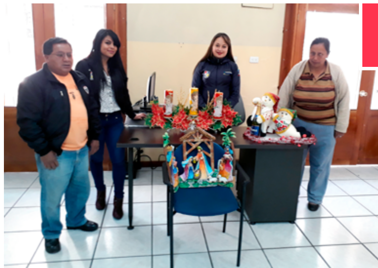
SIL Carchi | Curso de manualidades navideñas en tela, cerámica y pintura.