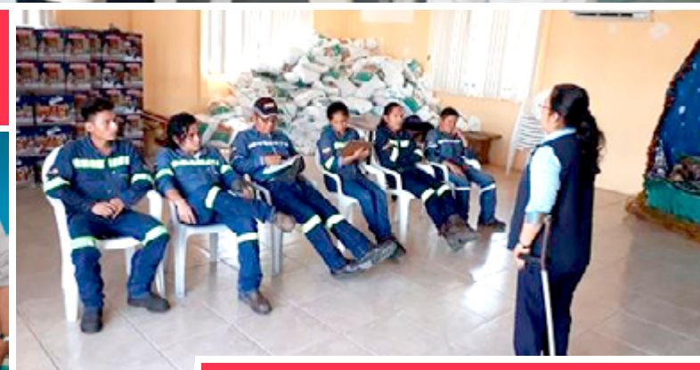
SIL Orellana | Taller Mandamientos Laborales en el Ambito de lo Laboral.