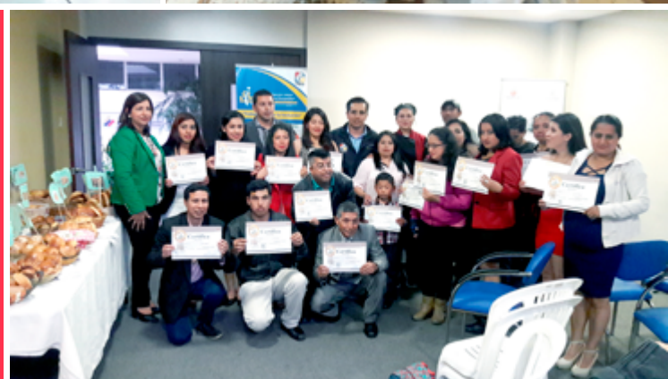
SIL Loja | Taller de Panadería con la participación de 40 usuarios con discapacidad.