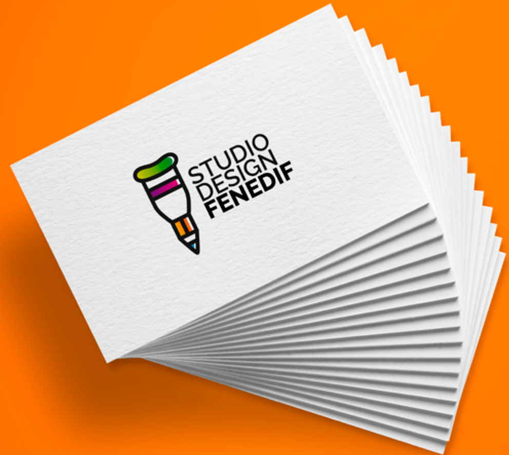
Imagen Corporativa Diseño Editorial Packaging Ilustración