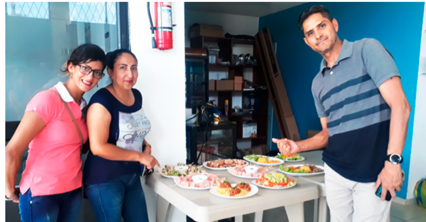
SIL Pastaza | Taller de Emprendimiento y Cocina con una duración de 30 horas.