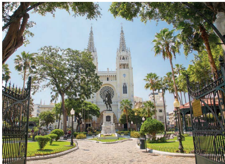
En Guayaquil es privilegiada por las bondades del Río Guayas.