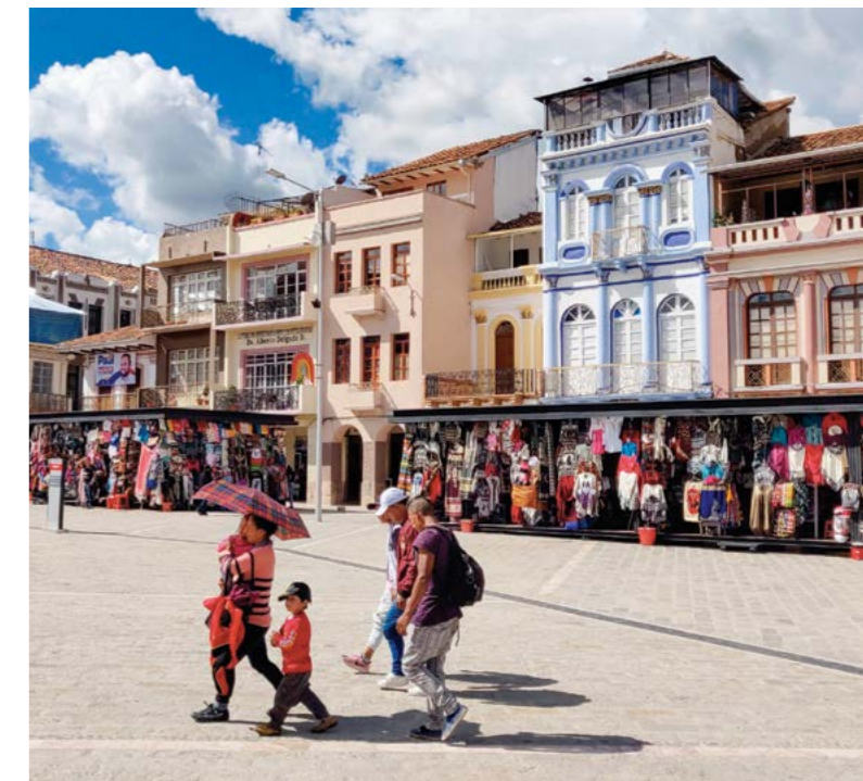
El Centro Histórico de Cuenca es Patrimonio Cultural de la Humanidad.

En el Casco Colonial encontramos una gran cantidad de edificaciones históricas y republicanas de gran hermosura; la zona arqueológica; los barrios artesanales (de origen colonial); los mercados centrales; el Barranco del Tomebamba con el Paseo 3 de Noviembre y varios sitios de importancia paisajística y cultural, como Mirador de Turi, Plaza de Vado, Plaza Las Flores, Parque Abdón Calderón, son algunos de los sitios que forman parte de este circuito accesible y hacen de Cuenca una ciudad maravillosa y un sitio turístico destacado.