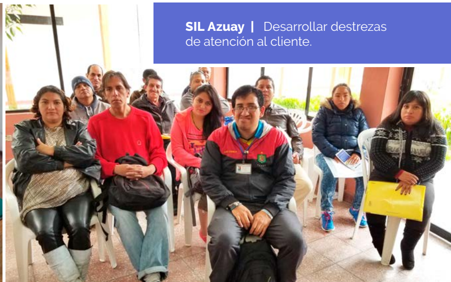
SIL Azuay | Desarrollar destrezas de atención al cliente.