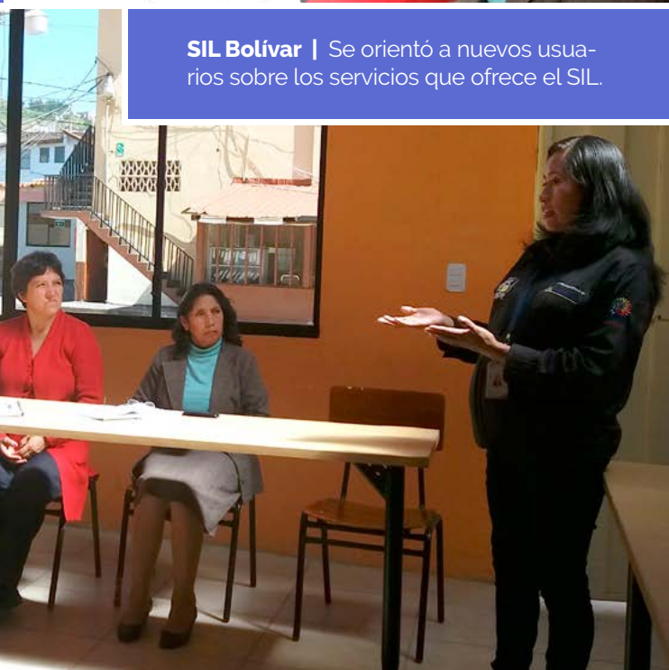
SIL Bolívar | Se orientó a nuevos usuarios sobre los servicios que ofrece el SIL.