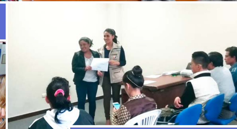
SIL Loja | Se orientó a nuevos usuarios con discapacidad.