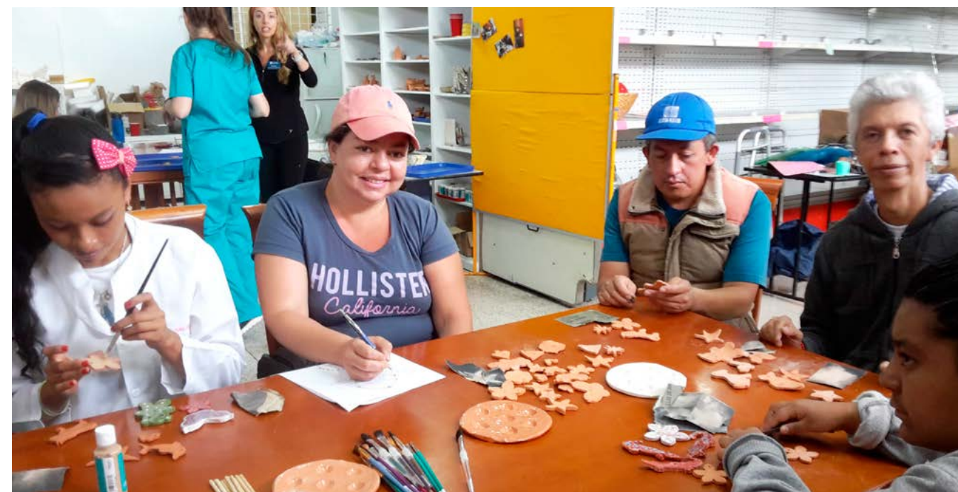
SIL Imbabura | PRODISPRO se capacitó sobre lenguaje positivo.